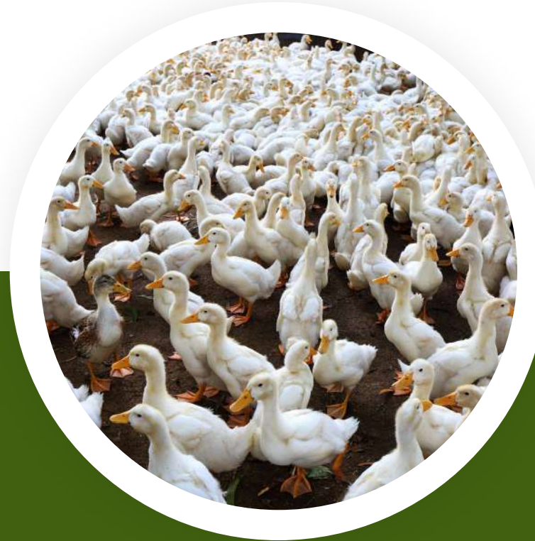
5.7 ศูนย์สาธิต การเลี้ยงสัตว์ โครงการหมู่บ้าน ปศุสัตว์-เกษตรมูโนะ