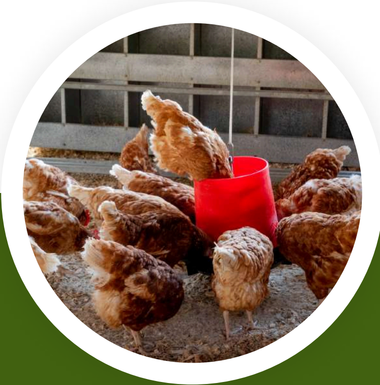
5.6 งานปศุสัตว์ โครงการศูนย์ศึกษา การพัฒนาพิกุลทอง