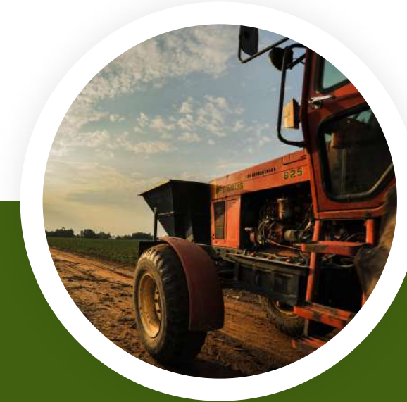
5.8 ปศุสัตว์อำเภอ ( 13 อำเภอ )