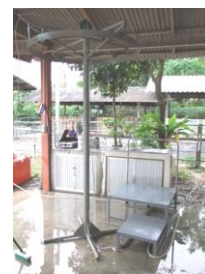
ภาพที่ 3 เสาแขวนชำแหละซาก พร้อมแขนแขวนซากแบบขยายขนาดได้