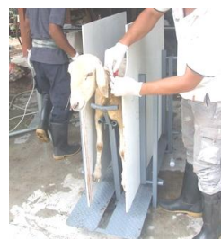
ภาพที่ 2 แท่นเชือดแพะแกะ แบบไม่ต้องใช้การผูกมัดตัวสัตว์